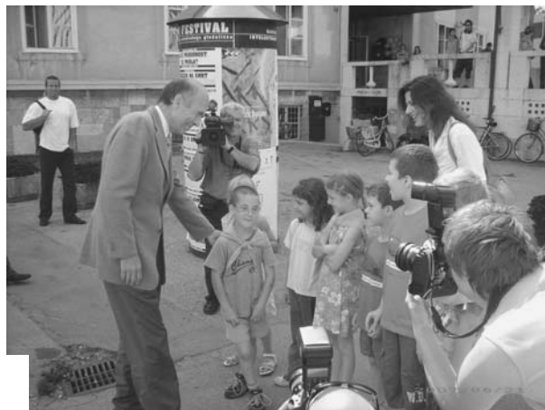
Predsednik dr. Janez Drnovšek v družbi najmlajših, vključenih v Sadeže družbe, na zaključni prireditvi projekta za šolsko leto 2006/2007

Ob vseh teh aktivnostih samo na Slovenski filantropiji organizirali tudi vrsto dogodkov, katerih namen je bil širši javnosti predstaviti Sadeže družbe – aktivnosti, prostovoljke in prostovoljce, starejše – in si tako zagotoviti čim širšo podporo za uspešno izvajanje projekta.