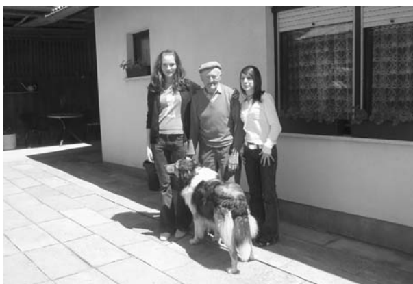
OŠ KUZMA 3: Prostovoljki na sprehodu s starejšim krajanom in njegovim psom.

Včasih so stari starši živeli s svojimi otroki, vnukinjami in vnuki. Vpeti so bili v družbeno življenje skupnosti. Bolne so jih negovali mlajši družinski člani.