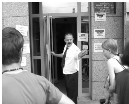
"V kot stisnjeni in zadrževani" varnostnik