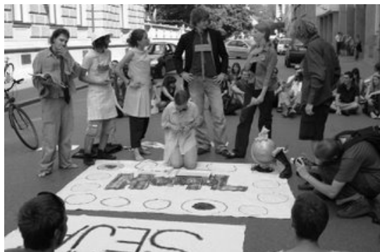
igranje Monopola pred vlado, kjer so študentke in študenti odstavili Zupana, ki se je z Janšo zavzel zoper blaginjo.

30. maj: zasedba že tretje fakultete in sicer Fakultete za socialno delo