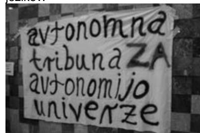
Transparent v avli Filozofske fakultete

21. maja 2007: se zgodi zasedba avle Filozofske fakultete v Ljubljani pod geslom Avtonomna tribuna za avtonomijo univerze. Seveda, ne gre čisto brez zapletov, saj varnostniki ne pustijo izobesiti transparenta, a na koncu omagajo. Sama ideja za zasedbo je nastala na debati v metelkovskem Infoshopu, kjer se je nekaj dni pred tem razpravljalo o apatiji študentarije in o privatizaciji univerz. Sprejme se izjava, ki kratkem času dobi veliko podpore (Moderna Galerija, ŠOS, ŠKIS, ŠOU LJ, ŠOU Primorska, Mirovni inštitut, Odbor študentov humanistike iz Kopra, Zares, CIIA, AntiFacafe, Erasmusovi študenti v Sloveniji, Mladi Forum, več visokošolskih delavcev in delavk,...) preberete pa si jo lahko na koncu prispevka. Med drugim pa je bila prevedena v 7 tujih jezikov.